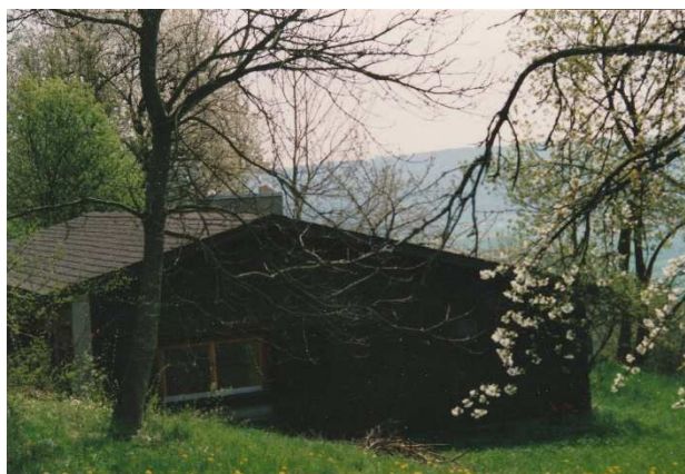
Das «Bergli» am Randen

Dank einem glücklichen Zufall konnte Heini in Siblingen an der Halde ein Stück Land erwerben und noch vor der Zonenordnung ein kleines Ferienhaus bauen, das "Bergli": für die Familie ein Sonnenparadies, später für manche Ferienort oder Festgelände.