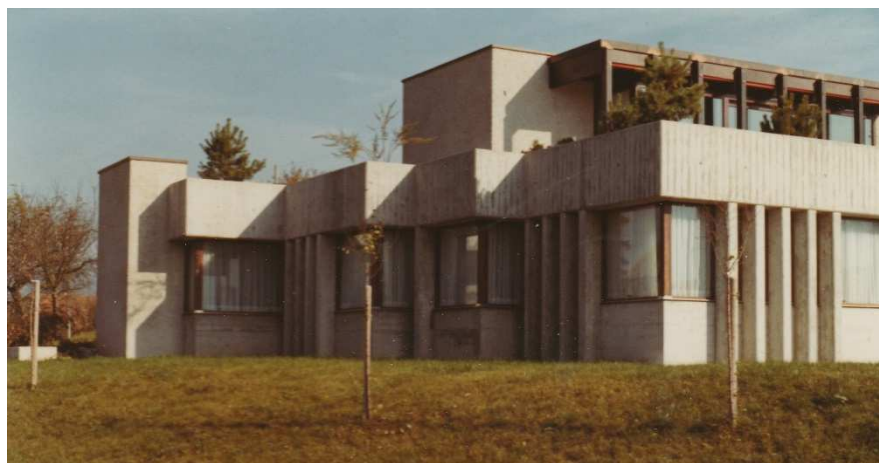
Das «Doktorhaus» in Neunkirch