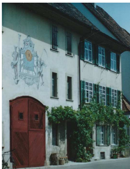
Das «Rietmann'sche Haus» in Neunkirch